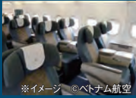
※イメージ

■旅行代金カレンダー ※出発日より旅行代金が異なります。カレンダーと旅行代金表のアルファベットを照合してください。