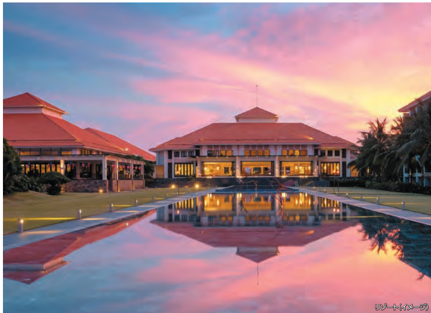
リゾート(イメージ)