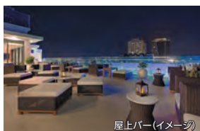
屋上バー(イメージ)