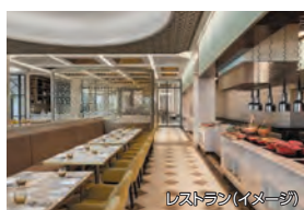
レストラン(イメージ)