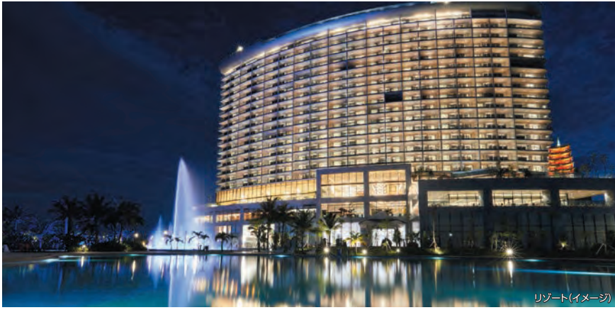
リゾート(イメージ)