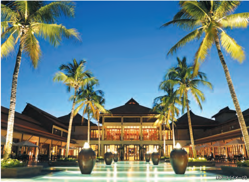
リゾート(イメージ)