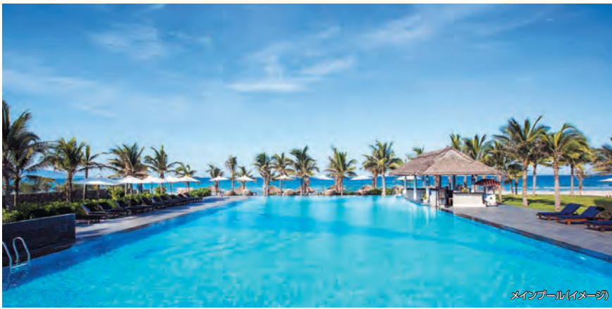
メインプール(イメージ)