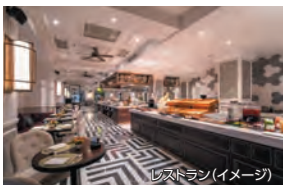
レストラン(イメージ)