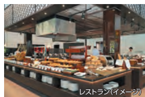
レストラン(イメージ)