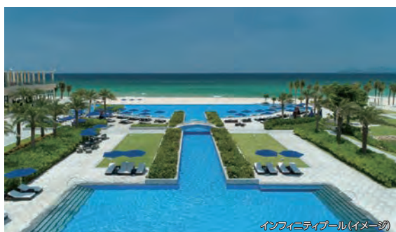
インフィニティプール(イメージ)