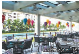
レストラン(イメージ)