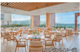
レストラン(イメージ)