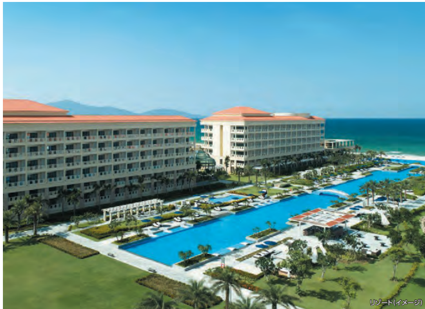
リゾート(イメージ)