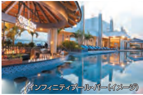
インフィニティプール(イメージ)