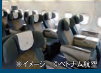
※イメージ

■旅行代金カレンダー ※出発日より旅行代金が異なります。カレンダーと旅行代金表のアルファベットを照合してください。