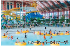
ウォーターパーク(イメージ)