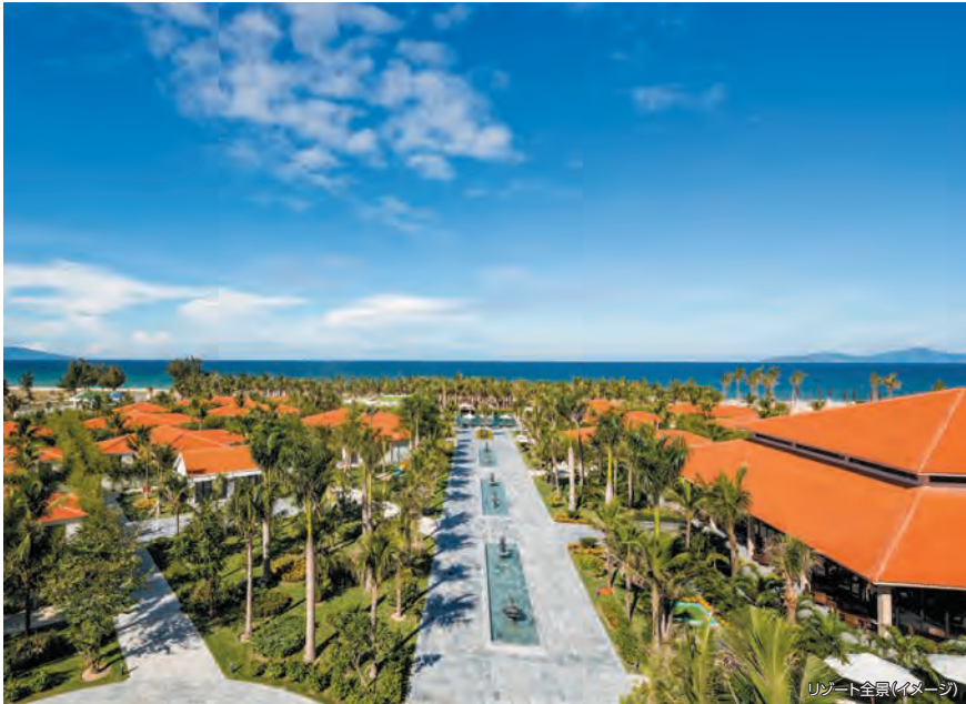
リゾート全景(イメージ)