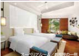
スーベリアルーム/お部屋の一例