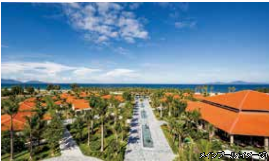
メインプール(イメージ)