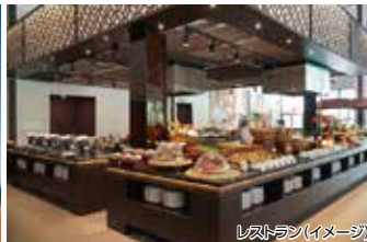
レストラン(イメージ)