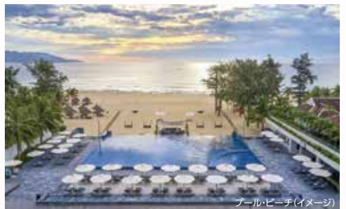
プール・ビーチ(イメージ)