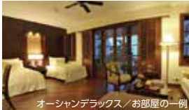
オーシャンデラックス/お部屋の一例