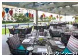
レストラン(イメージ)