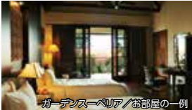
ガーデンスイーベリア/お部屋の一例