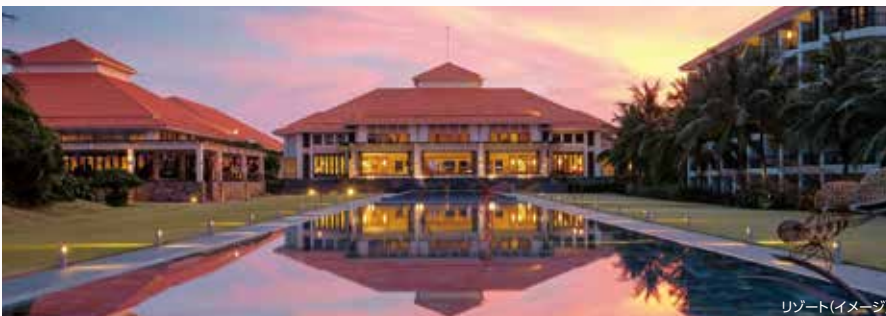
リゾート(イメージ)