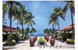
リゾート(イメージ)