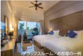
デラックスルーム/お部屋の一例