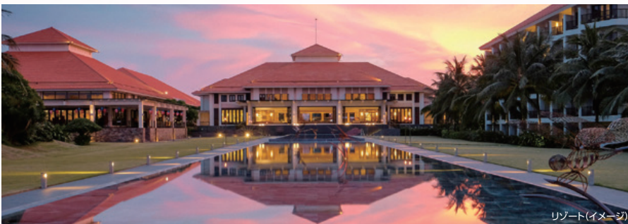
リゾート(イメージ)