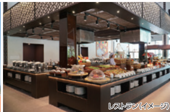
レストラン(イメージ)