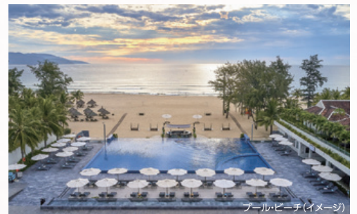
プール・ビーチ(イメージ)