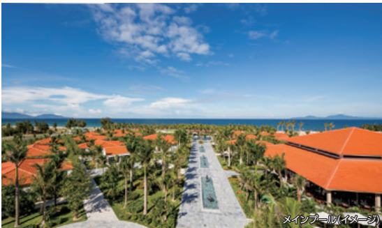
メインプール(イメージ)