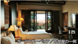
ガーデンズベリア/お部屋の一例