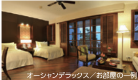
オーシャンデラックス/お部屋の一例