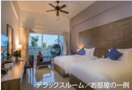
デラックスルーム/お部屋の一例