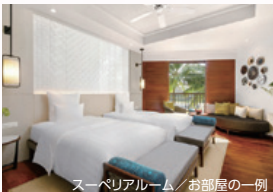
スーベリアルーム/お部屋の一例