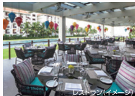
レストラン(イメージ)