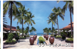
リゾート(イメージ)